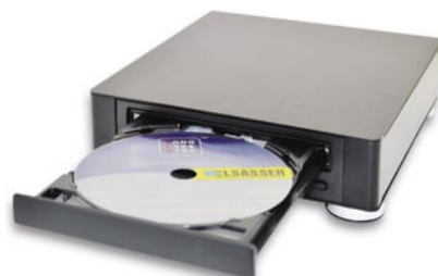
LongLifeDisc™ – ein neuer Maßstab der Datenspeicherung

Hackl, CEO von DaTARIUS und ergänzt: „Wir bieten unseren Kunden eine einzigartige Lösung mit Hardware, Software, dem Speichermedium und dem Archivierungsprozess an. Die Daten sind wie in Stein gemeißelt und geschützt.“ Durch ausführliche Klimatests nach ECMA wurde eine unbegrenzte Haltbarkeit unter Beweis gestellt und wird auch garantiert. Jede einzelne Disc wird im Prozess geprüft und verifiziert bzw. kann auch verschlüsselt werden. Die LongLifeDisc kann in vielen Bereichen eingesetzt werden, in denen Datensicherheit und Langlebigkeit im Vordergrund stehen. Zum Beispiel Universitäten, Bibliotheken, Steuer- und Wirtschaftsberater, Gemeinden, Banken und natürlich Unternehmen, die sich ein sicheres Firmen Backup verschaffen wollen. Im privaten Bereich sind es Videos, Bilder und Daten, die man für seine Nachkommen sicherstellen möchte. Für mehr Informationen senden sie eine E-Mail an: info@datarius.com