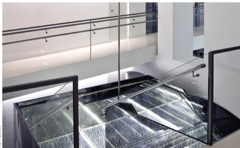
Für Swarovski Innsbruck – einer der weltweit größten Swarovski Stores – produzierte PACT Technologies in vier Monaten eine glitzernde Treppe aus rund 20.000 Kristallen.

Die Herausforderungen dieser Designinnovation aus Tirol lagen darin, bei der Verarbeitung von