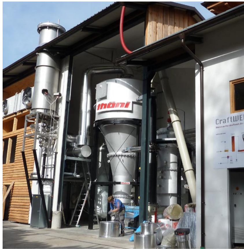
Die Thöni Industriebetriebe GmbH hat das Biomassekraftwerk in Innichen in gerade einmal sechs Monaten Bauzeit errichtet.